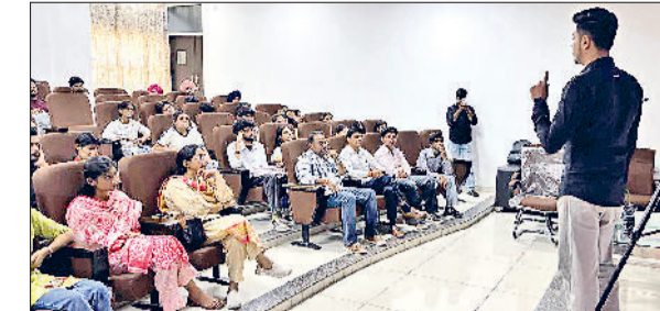
सिरसा। विद्यार्थियों को फोटोग्राफी की बारीकियां बताते हुए।