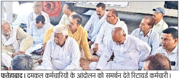
फतेहाबाद। दमकल कर्मचारियों के आंदोलन को समर्थन देते रिटायर्ड कर्मचारी।