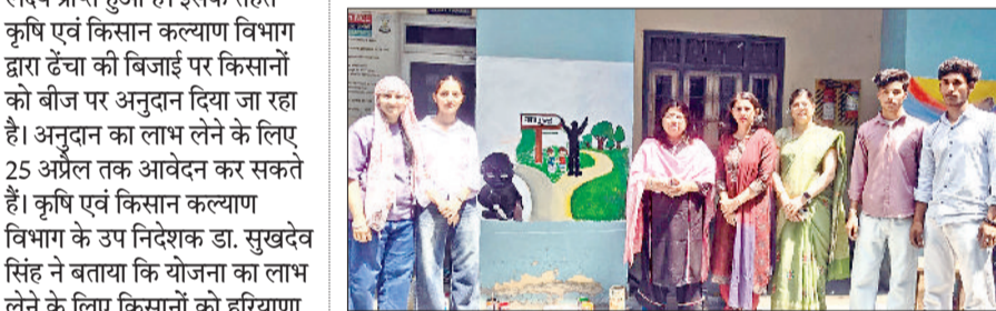
सिरसा। विद्यार्थियों द्वारा बनाई गई पोर्टल।