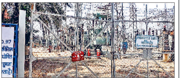
फतेहाबाद। भट्ट रोड पर स्थित 132 केवी सब स्टेशन।

अनुसार फरवरी मास में प्रतिदिन 29 लाख से 40 लाख यूनिट प्रतिदिन की डिमांड थी जोकि मार्च में बढ़कर 35 लाख से 52 लाख तक यूनिट प्रतिदिन तक पहुंच गई। अप्रैल में गेहूं का सीजन आया तो दक्षिण हरियाणा बिजली वितरण निगम ने गांवों में 12 घंटे बिजली कटौती शुरू कर दी ताकि गेहूं की फसल को कोई नुकसान न पहुंचे। इस सबके चलते भी अप्रैल में कटौती के बावजूद 40 लाख यूनिट प्रतिदिन की डिमांड आ रही है। बता दें कि जिला में करीब 1 लाख 50 हजार हेक्टेयर भूमि पर धान की खेती होती है। धान की बिजली 15 जून से शुरू होगी है। धान की फसल में पानी की अधिक आवश्यकता होती है और नहरों में पानी की कमी के चलते किसान ट्यूबवेलों पर ज्यादा निर्भर रहते हैं। ऐसे में बिजली की मांग बढ़ेगी और बिजली के कट लगेंगे। इस बार तापमान अप्रैल में ही बढ़ने से निगम के अधिकारियों की चिंता सताने लगी है कि जून में इसकी भरपाई