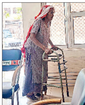
मट्टूकलां। कमेटी कार्यालय में बायोमैट्रिक के लिए पहुंची बीमार बुजुर्ग महिला।