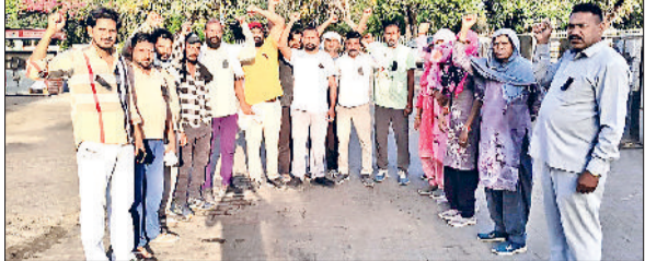
फतेहाबाद। काले बिल्ले लगाकर विरोध जताते नगरपरिषद कर्मचारी।