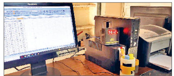
फतेहाबाद। बिजली घर में फ्रिक्वेंसी दिखाता मीटर।

पिछले कई दिनों से लगातार बढ़ रहे तापमान से जिले में बिजली की मांग बढ़ने लगी है। इन दिनों निगम के पास फ्रिक्वेंसी का लेवल 50.12 तक पहुंच गया है, जोकि 48 के नीचे आते ही बिजली के कट लगने शुरू हो जाएंगे। यहां पर पानीपत थर्मल से वाया नरवाना बिजली की आपूर्ति होती है। तापमान में जब बिजली की डिमांड बढ़ती है तो इसका सीधा असर लाइन पर पड़ता है। लाइन पर बोझ पड़ते ही फ्रिक्वेंसी का स्तर डाऊन आ जाता है। इन दिनों अप्रैल महीने की बात करे तो फरवरी से करीब 2 करोड़ यूनिट ज्यादा की मांग चल रही है। बता दें कि अभी गेहूं कटाई के सीजन के कारण गांवों में बिजली सप्लाई दिन के समय बंद रहती है। ऐसे में आगे धान का सीजन आने पर बिजली की कितनी मांग बढ़ेगी, यह सोचकर अभी से बिजली निगम के अधिकारियों की चिंता बढ़ गई है। प्राप्त जानकारी के