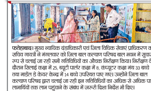
फतेहाबाद। मुख्य व्यायक दंडाधिकारी एवं जिला विधिक सेवाएं प्राधिकरण की सचिव गायत्री ने मंगलवार को जिला बाल कल्याण परिषद बाल भवन में सुचारु रूप से चलाई जा रही सभी गतिविधियों का औचक निरीक्षण किया। निरीक्षण के दौरान सिलाई कक्षा में 25, ह्यूटी पार्लर कक्षा में 8, कंप्यूटर कक्षा में 33 बच्चे तथा गार्डन डे केयर केन्द्र में 14 बच्चे उपस्थित पाए गए। उन्होंने जिला बाल कल्याण परिषद द्वारा चलाई जा रही इन गतिविधियों का अधिक से अधिक पाठ लाभार्थियों तक लाभ पहुंचाने के संबंध में जरूरी दिशा निर्देश भी दिए।