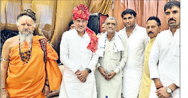
टोहाना। जयंती समारोह में भाग लेते सांसद सुभाष बराला।

राज्यसभा सांसद सुभाष ने मंगलवार को धन्ना भगत जयंती के पावन अवसर पर संत शिरोमणि श्री गुरु भगत धन्ना जाट सेवा समिति ट्रस्ट धारसूल द्वारा गांव धारसूल में आयोजित कार्यक्रम में मुख्य अतिथि के रूप में शिरकत की। क्षेत्र के युवाओं को शिक्षा और ज्ञान से जोड़ने के इस पुनीत अवसर पर, राज्यसभा