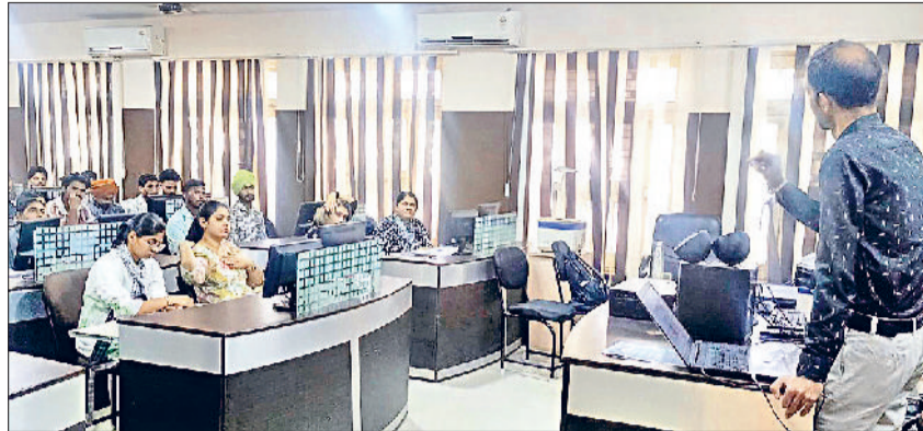
फतेहाबाद। बीएड कॉलेज में स्वगणना को लेकर आयोजित वर्कशॉप को संबोधित करते वक्ता।