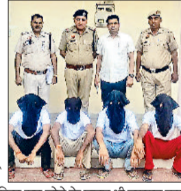
भटुकाना। घर में घुसकर जानलेवा हमला करने, तोड़फोड़ करने और जातिव्युत्क गालियां देने के मामले में त्वरित कार्रवाई करते हुए भटुकाना पुलिस ने चार मुख्य आरोपियों को गिरफ्तार कर लिया है।