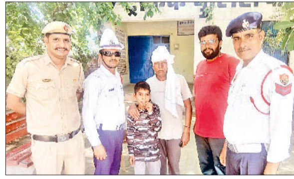
फतेहाबाद। बच्चे को उसके परिजनों को सौंपते पुलिस कर्मचारी।

फतेहाबाद पुलिस ने आज अपराध नियंत्रण से इतर इंसानियत की एक मिसाल पेश की है। राइडर पुलिस टीम ने तत्परता दिखाते हुए एक 13 वर्षीय मंदबुद्धि बालक को सुरक्षित उसके परिवार तक पहुंचाया। पुलिस की इस कार्यप्रणाली और सूझबूझ की पूरे शहर में सराहना हो रही है। मामला मंगलवार दोपहर का है, जब सिरसा से हिसार की तरफ जा रही एक बस पुराने बस स्टैंड पर रुकी। बस से उतरी कुछ